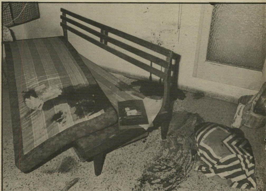
הרצח בעין־כרם: מיטות ההורים והאחיות אחרי הזוועה