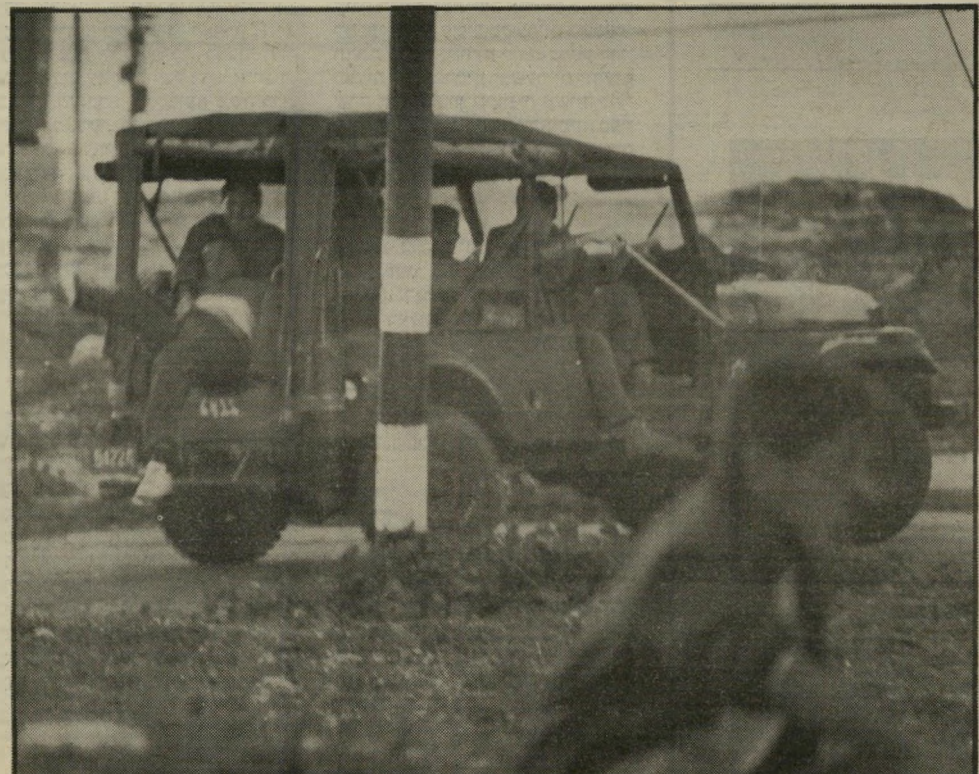
נער בורח, נער שני נגרר לגימ -אתה גרוע מחיה!"