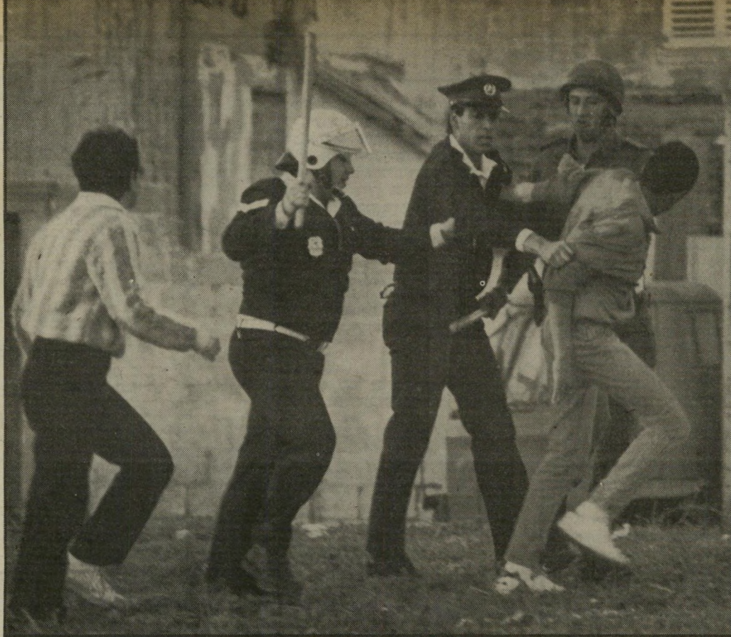
נער ערבי נגרר למעצר אחרי הפגנת כהנא ביפו -תראו שוטר, תברחו ממנו מרוב פחד!

בטיפול רפואי. "איש מישמר-הגבול שעמד לירי, לא הפסיק להציק לי. תנסה לברוח, ואני מייד יורה בך ומפוצץ לך את הפרצוף!" הוא אמר לי. בחצות הוחזר ג'ודה לתחנת-המישמר. במשך שלוש שעות עמדת שם וחיכיתי לחוקר. עמדתי על הרגליים. פחדתי לשבת. לא רציתי שירביצו לי עוד פעם. ביצו לפנות בוקר, אחרי חקירה קצרה, שיחררו אותי.