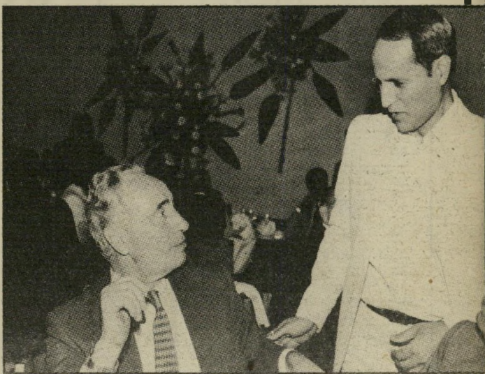
י"ר אדרי (עם פרס) לא לבייש את ראש-הממשלה