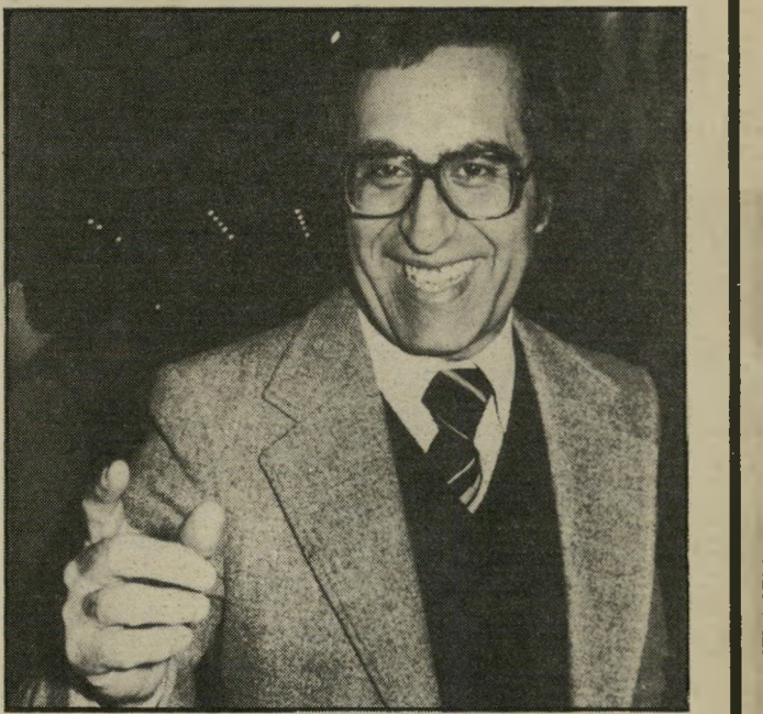
שר שחל עשה את הקנוניה