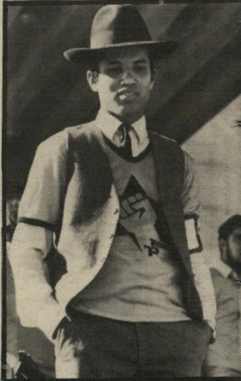
הנוער בנינוער רבים השתתפו בוועידה. בתצלום: אחד מחברי תנועת-הנוער.