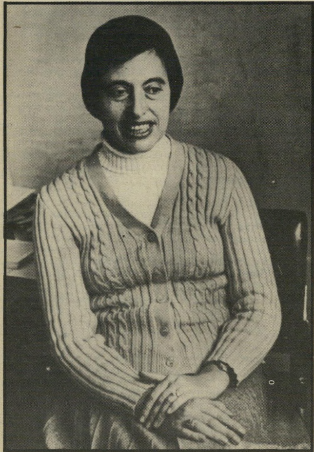
מועמדת אלבק השביס וקרקעות הגדה

ה עייפות לא צנחה על יצחק זמיר לפתע. סימניה של עייפות זו נראו כבר לפני כמה חודשים. מייך לאחר הדיון בשאלה אם ממשלת ישראל רשאית להחליט על נסיגה מהשטחים הכבושים, נראה היה כי זמיר מתעייף. גם הטיטוריום שי זיטרה אותו ועדת החוקה החוקר מישפט של הכנסת לא הקלו על עייפותו. הוא שבוע מרורים בשיבות הוועדה, כאשר חבריה גאולה כהן ומיכאל איתן תקפו אותו כנאומים שלוחי-רסן.