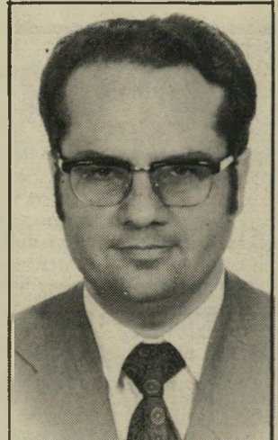
מועמד גבאי אפרוריות משתלמת

איבת גוש-אמונים כדי להתרחק מהעולם הפוליטי, יהיה על ניסים לפנות למישרד המישפטיים או לאקדמיה. ממישרד-