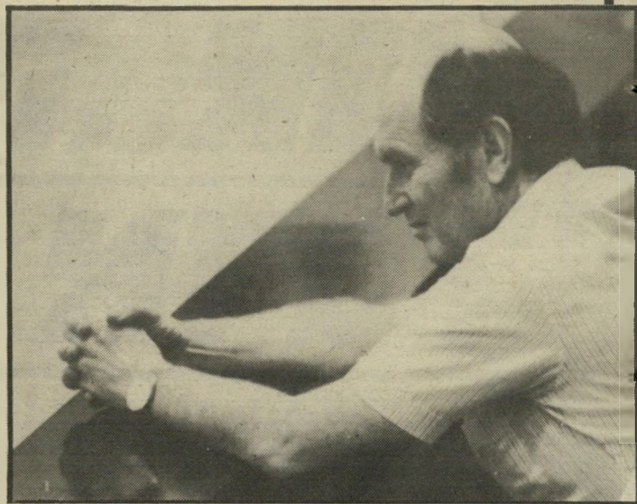
מתפטר זמיר המילה האחרונה לפרס