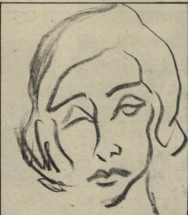
הוא ידע את רוב שיריו בעל-פה

הם יכולים לקנות לעצמם מכונת חרשה כל שעוה שיעלה הרצון מלפניהם. ועיני כולנו רואות ונפשנו כלה: למרחקים, למרחבים ולמכונת הנהרסת סתם כך בדהירה מטורפת, לשם שעשוע, מתוך לצון של צלולואיד ועל חשבון הכארון.