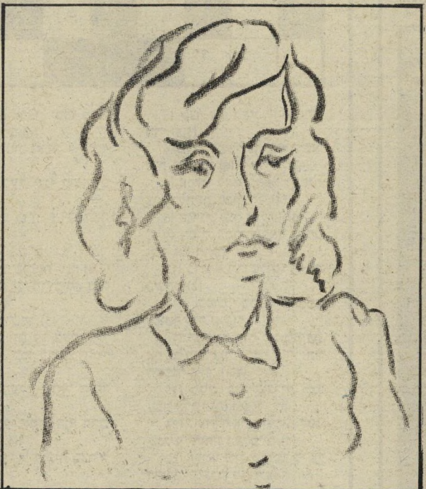
ממש חוטף לי בלוק ועפרון ורושם