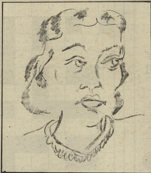
לוחש את השירים לתוך האוזן