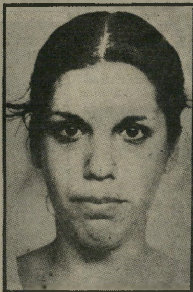
מונצחת הדם קרמי יש טרגדיות

כך או אחרת, עובדה לא נעימה ליוזמים: איסר הראל, הכוהן הגדול של הביון הישראלי, שהיה ראש הש"ב והמוסד, השיב כך על שאלותיי: "איני קשור לזה. לא נועצו בי