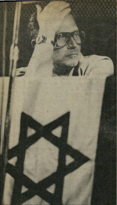
אישי-מודיעין יריב יש בעיות

יקשתי לקיים שיחה שניה עם המנכ"ל דליות, שהבטיח להשיב לי בה על