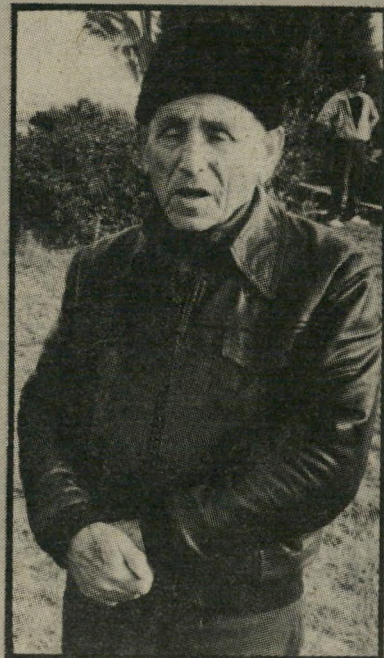
אישי-מודיעין הראל יש סנטימנטים

עת שביקרת בארץ-הנצחה של מ.ל.מ. היו חוקים בלוחות המבוק" 361 שמות חללים, כדי להדוף לחצים צפויים, קבעו המארגנים קריטריונים ונוה" לים מי זכאי להנצחה על קירות האבן-שיש הבהירים והדהויים, ומי אינו זכאי לאותו