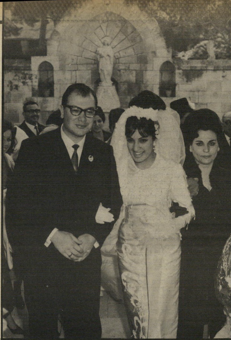
סניורה עם נורמה בחתונתם בקתדרלת סנט-ג'וזף (1966) "אני יודע שהתפקיד קשה ומסוכן..."

נסוגו ממנה אחרי שנה. חשבתי שכך יהיה גם הפעם, שאחרי שנה או אפילו פחות ישראל תיסוג. לכן חציתי את גשר הירדן בביטחון כדי לנסוע להודו ולגמור את הלימודים. הייתי בטוח שכאשר אחזור, בקיץ 1968, הרברים יחזרו להיות נורמליים.