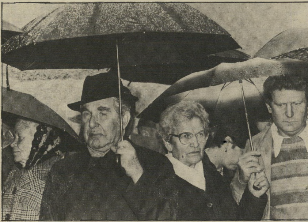
ומאות מיטריות נשלפו ונפרשו. וכך, מתחת למיט"ריות שחורות, הספידו שימעון פרס ויצחק בן-אהרון את גלילי. לצידו של הנשיא עומדים האלמנה ובנה.