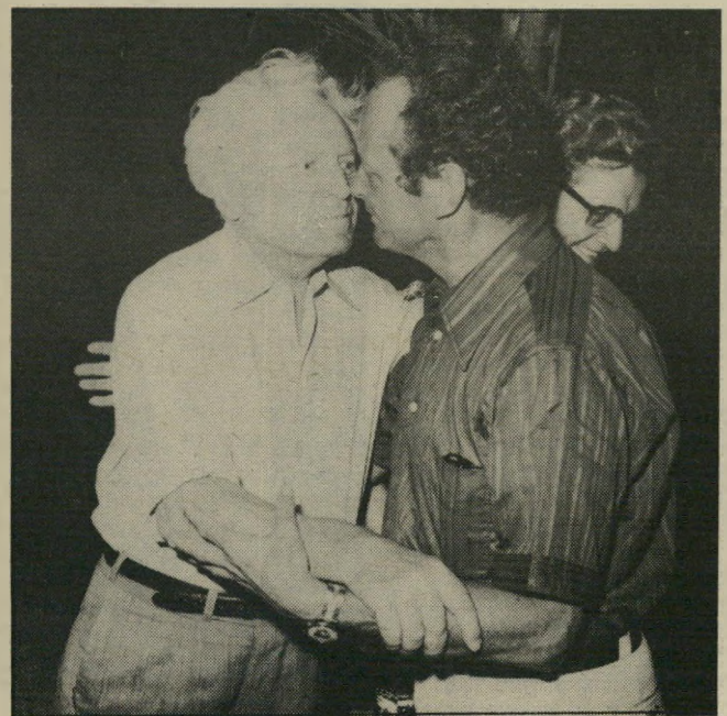
עם אלון בכנס ותיקי הפלמ"ח תוכנית לסיפוח ביקעת-הירדן