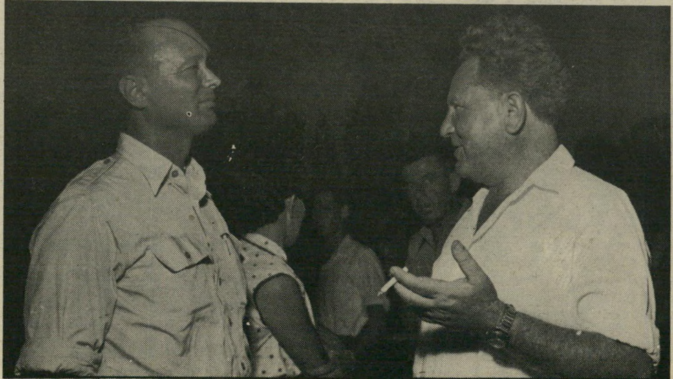
עם דיין באזרכה ליצחק שדה (1954) אלפי הרוגים למען ימית