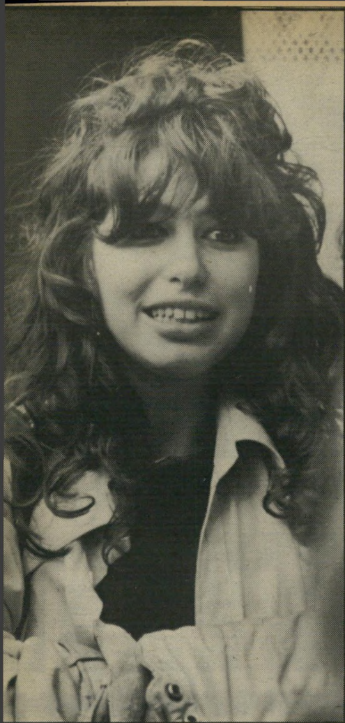
סיגל בת 17 אינני רואה את עצמי אם בגיל 17