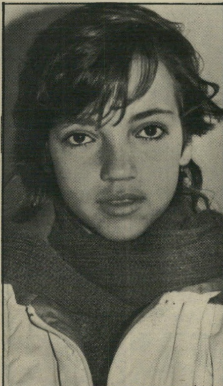
סידני בת 14 הייתי עושה אותו דבר

בת 20, מבוגרת מספיק כדי ללכת לאסיפות-הורים. הנער בן ה-15 וחצי, בן למישפחה הרוסיה, גר בבית סבו. הסב ניסה