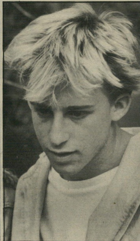
גרג בן 18 אני לא מבין את הרעש