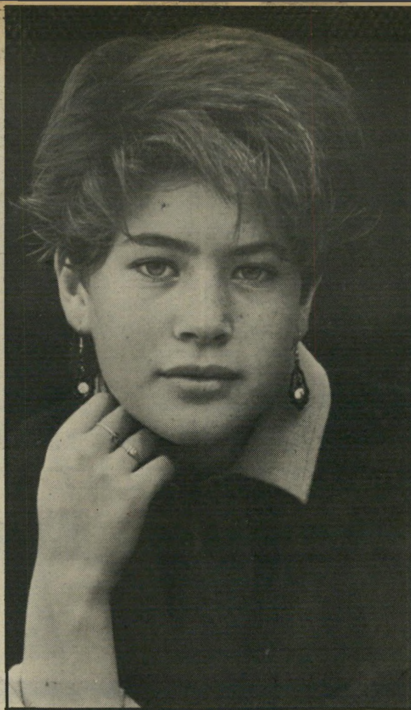
שירלי בת 12 אני יוצאת עם בנים ומגיעים עד נשיקה