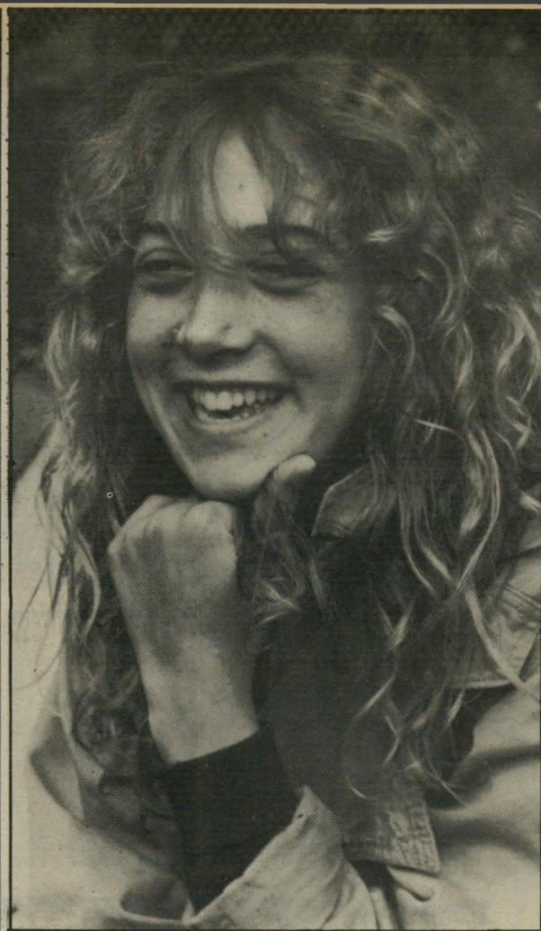
ענבל בת 15 אמא תאמר שאני זנונת