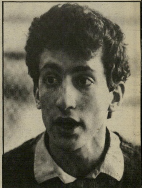
גירמי בן 16 זאת תאוונה