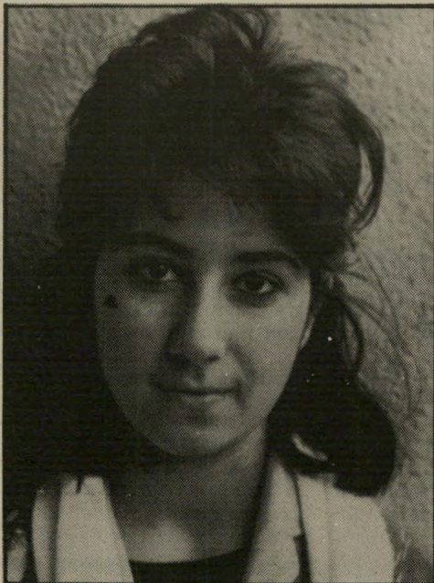
רויטל בת 15 עד התגורה וזהר