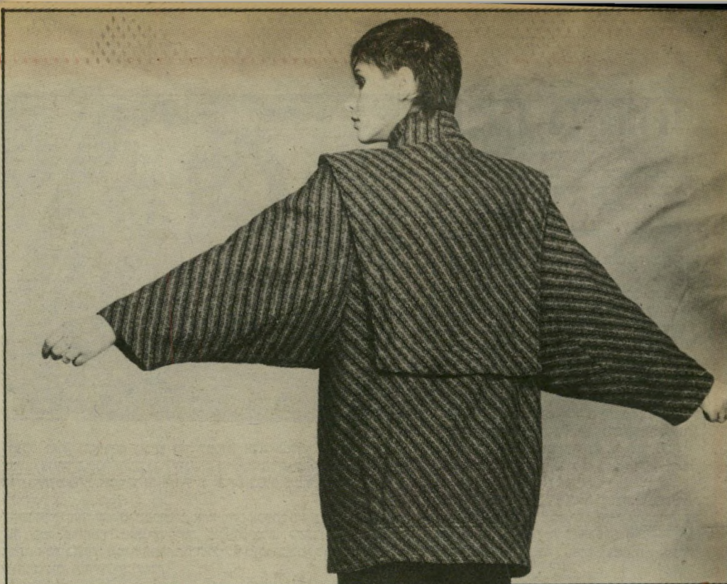
השרוול רחב ונוח, בסיגנון עטלף. מעיל אלגנטי וספורטיבי לכל שעות היום והערב. את צווארון הסרפז ניתן לנצל ביום גשם - ככובע לשעת צרה.