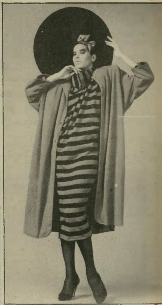
כחול מזעזע סריג אנגורה רך, נעים, מחמם ומלטף, ממנו עיצב רזיאלה גרשון מעיל אשר כתפיו מודגשות.