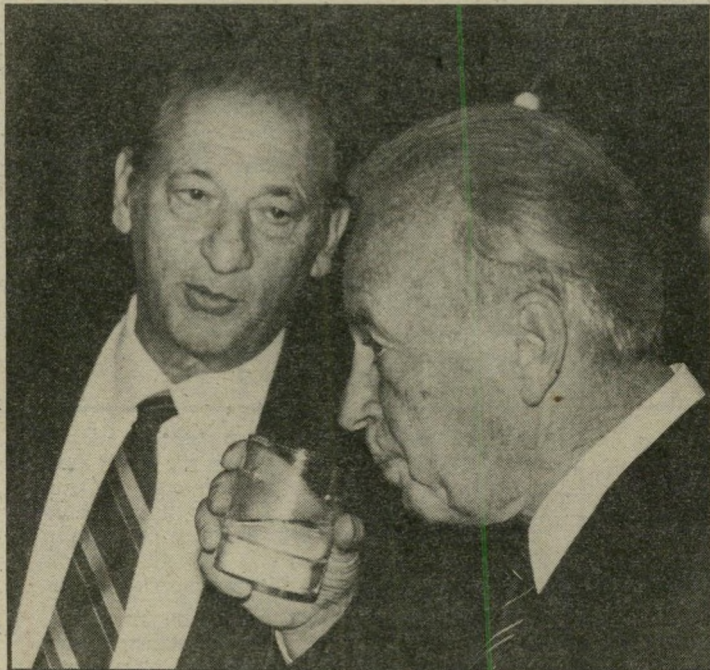
שרי-כיטחון רבין השבועי מישקע רגשות. לא מוח אנאליטי

טרור נגרנו ממשך לשגשג. הרגש מצווה: מוכרחים לעשות משהו. מוכרחה להיות תרופה כלשהי. אם הפעולה הקודמת לא הועילה, צריכים לבצע פעולה יותר גדולה יותר חזקה, יותר מדהימה. ואז, כשבאה הודמנות פיתאומית וצריכים להחליט כלי הכנה מוקדמת, מחליטים על פעולות חסרות-שחר כאלה.