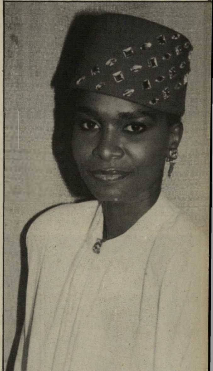
אבנים נוצצות על כובע חסר-שוליים דמוי סיר-לילה. הכו-בע עשוי צמר או לבד קשוח ומעוטר ב-אבנים נוצצות. המשולבות בצורה אלכסונית ומותאמות לגוון הכובע.