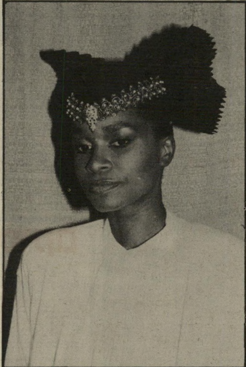
האחורי של הכובע פרפר שחור. משמאל: כובע קרפ מוזהב, מעוטר בסיכות-פנינים ואבני-זהב. זאת היא התשובה לכל הנמוכות הרוצות להיראות גבוהות.