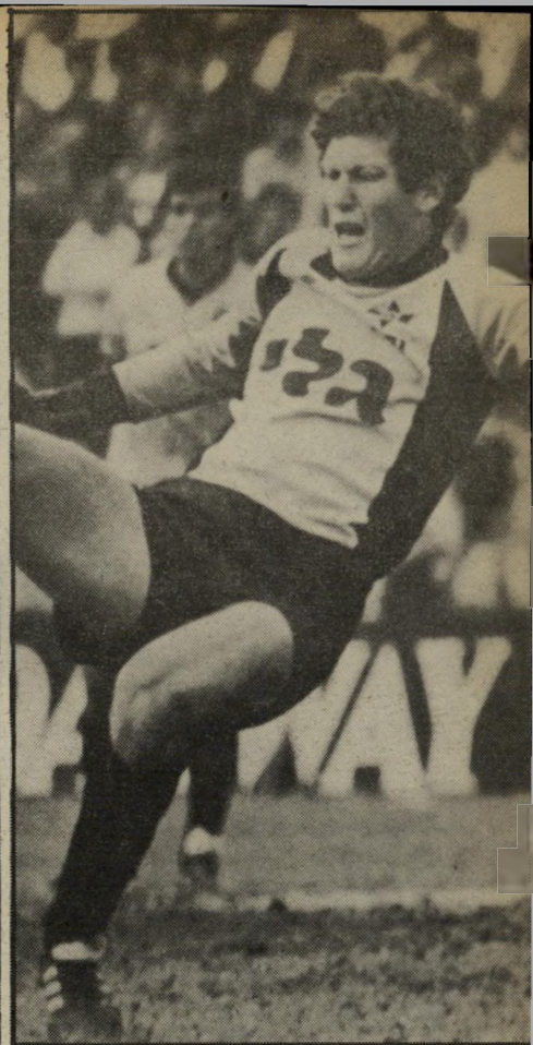
כדורגלן אלתר כל שנה: 15 אלף דולר