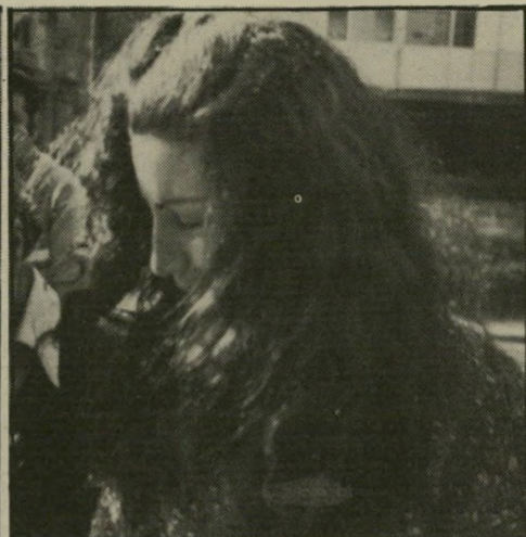
שרה: מבט מושפל גט לחומרה —