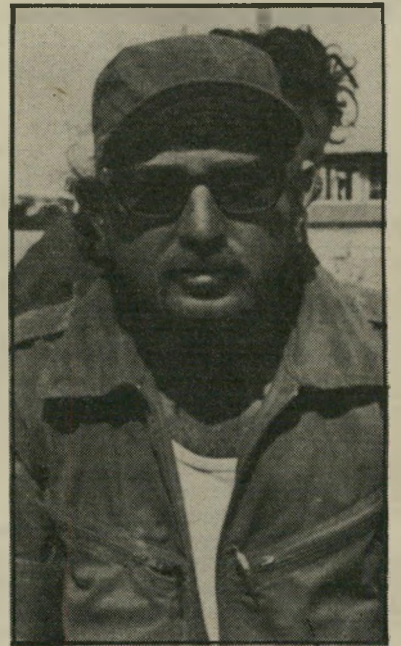
כתב אטינגר שדיים ואחוריים

באותו ערב הקדישה הטלוויזיה תוכנית שלמה מה השאלה: לנושא אפליית הנשים, אך לא