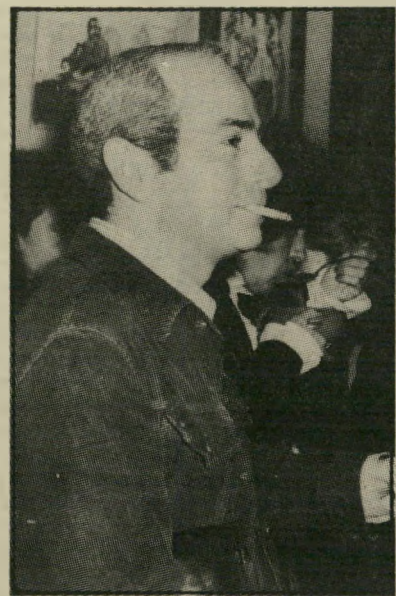
עורך שפירא עוז לי גוף לי

במקביל הגישו הטכנים תלונה מטעמם ליו"ר רשות-השידור, מיכה יבין, לוועד-המנהל, למנהל, אורי פורת, ולמנהל כוח-האדם של הרשות, את התלונה הגישה ההסתדרות הכללית, הסתדרות ההנדסאים וועד-הנדרסה. הם מגוללים שוב את סיפור-המעשה ביום שבו הואפל המירקע, ואומרים, בין השאר: 'נודע לוועד