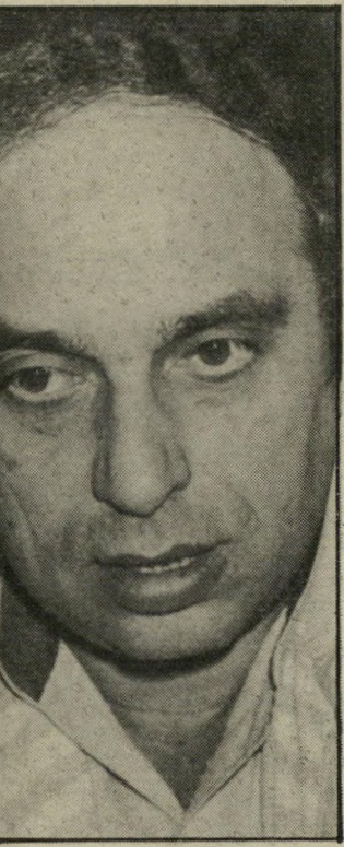
סוהר פולק לא מחפש מיטריה

אין לי כל כוונה להיות שם הרבה זמן. אני לא מסוגל. אני מבין שברגע שסויסה — יש לי המון הבנה איתו, הוא גם שלח לי פרחים הביתה, כשכל זה קרה — יחליט לקדם אותי, הוא עלול לזכות במיקלחת צוננים ולביקורת ציבורית.