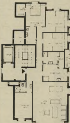
תוכנית דירה טיפוסית A

משרד המכירות פתוח במקום במשך כל שעות היום מגדלי זאב, ז'בוטינסקי 48 (פינת בית-חורון, מקביל לביאליק) טלפון: 03-731328 רמת-גן