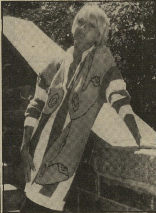
לבן, אדום, סגול, צהוב, כתום וטורקיז. הסוודרים נלבשים מעל למיכנסיים צרות והדוקות, או מעל חצאית מיני חושפנית, בטעם האישי של הלוברת.