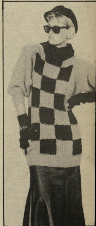
שחיתת סוודר יוניסקס עבה בסריגת-יד. לו ולה. עם משבצות שחור ולבן.

הסריגים האופנתיים האלה מופיעים גם בגווני מתכתיים, בסריגים הש' זורים חוטי לורקס, כסף, זהב, ירוק וכחול, כשהרגש נוסף מושם על הכת' פיים המרופדות. רגמים אלה מתאימים