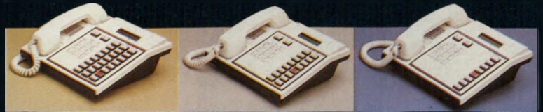
מערכות מלפון אלקטרוניות 24-16-8 לחצנים

מערכת התקשורת החדשנית ממשפחת "תדקס" לעסק הדורש מ-2 עד 16 שלוחות