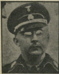
הימלר הזקן (בסרט) והימלר הצעיר (בחיים)

אולי. אבל אני חושד שהתופעה עמוקה יותר, והיא נובעת מכל תפיסת הזמן של הטלוויזיה הישראלית. חסר לה הקצב הט' לוויזיוני. כל ישראלי המודמן לארצות-הברית, לבריטניה ואף לאיטליה, חש מייד שהקצב שונה לגמרי. שם הוא נמדד בשניות, לא ברקות, ובוודאי לא בחצאי-שעות.