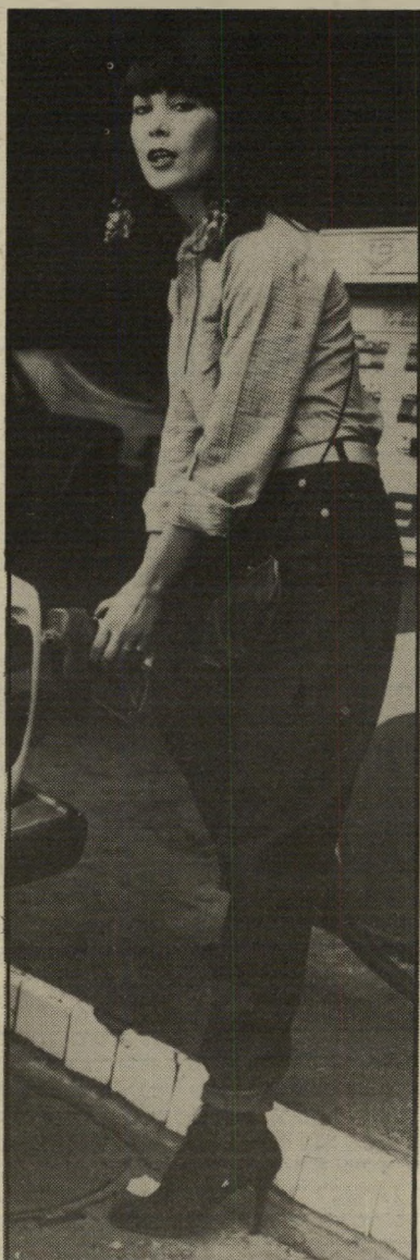
יפה כפיר יאכטה של ערבי

או היא הגשימה את חלומה. היא מצאה לעצמה משרה של מזכירה, וכל יום בבוקר היא מתלבשת בצורה סולידית ומתייצבת במשרד ב־8 בבוקר, כדי לעבוד בחריצות עד 4 אחר־הצהריים, ועכשיו סוף־סוף מותר לה גם לאכול ספאגטי וגם לעשות גרפס. ואף אחד לא יידע על זה.