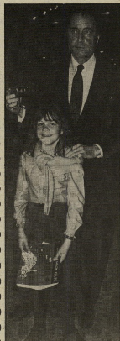
אפי ארזי ובתו התפייסות בלונדון

ככה זה בחיים. כשגברת כהן רבה עם בעלה, ארון כהן, אף אחד, מלבד השכנים מהקיר הסמוך, לא יודע על זה. אבל כשאפי ארזי מסאיטקס רב עם אשתו היפה, דינה ארזי, כל ישראל יוצאת מכליה. או הם רבו קצת, היה להם משרונצ'יק קטן. אז מה? למי מאיתנו אין כאלה, שישה בגרוש? בשביל זה צריך לפרסם בכל הארץ שהם נפרדו לגמרי? (אפי ארזי מלא בצלקות צורבות). החדשות האחרונות, חברים יקרים, הן שאפי