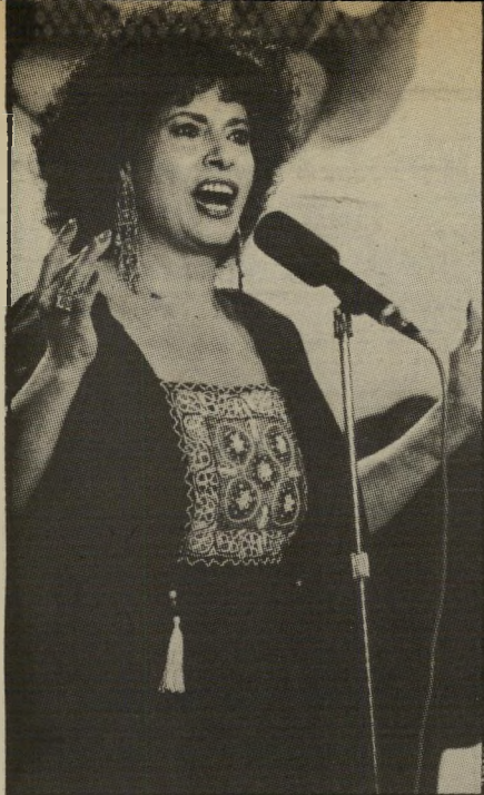
זמרת דמארי אותה אין לעזוב

אלוני מונה בהחלטת הוועדה-המנהל לתקופה של שנה. מינוי זה, לתקופה זו, הוא בניגוד להסכמים שיש להנהלת-הרשות עם אגודת הי עיתונאים. לפי ההסכמים לא ימונה מנהל לתקופה העולה