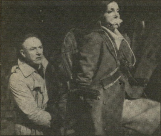
גיל האניקט וג'ון הקמן: האשה הממולכדת

ההמשך שייך לכל מסורת סירטי-הערפדים שראיתם אי-פעם