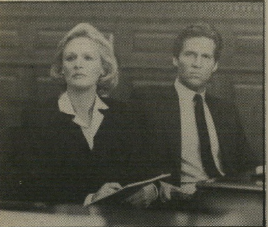
ג'ף ברידג'ס וגלן קלוס: היפה והחיה

מתברר שאביו אינו אותו האדם שנדמה היה לו שהכיר, תוך כדי היכרות מחודשת מתהפכים היוצרות - מי שנראה חדל-אישים, נראה לפתע כגיבור, התמים מתגלה כמושחת, המרדן כצבוע והמחדן כנועז. בריצה מטורפת על מני פאריס מרחפת לא אחת רוחו של ג'ון (הקשר הצרפתי) פרנקנהיימר, אבל גם משהו מקוראסאווה עבר כאן: מחזוריות הפטע - הנה עומדים לעשות לגיבור מה שעשה לאחרים.