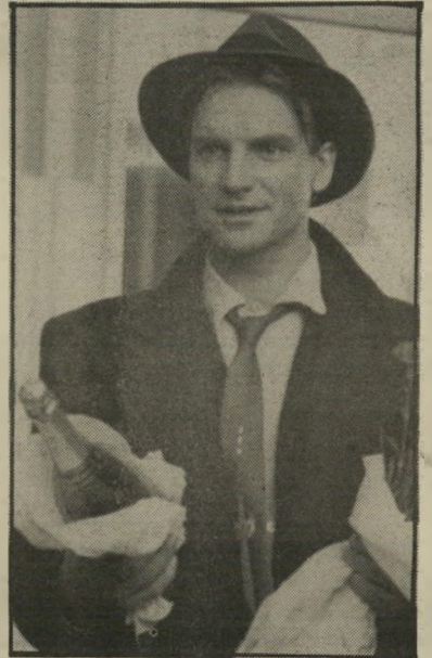
סטינג ב. הרבה ולא כלום מפתיע ממש

השבוע נערך סמינר רפואי ראשון מסוגו בהוליווד: הנושא - האם נשיקה צרפתית מסכנת את בריאותם של השחקנים. לאור הממצאים בנושא האידס, והאם יש להודיע על כך מראש לשחקן, כטרם חתם על החוזה? שאלה זו כבר עמדה במרכז דיוני איגודייהשחקנים מאז חודש אוקטובר. בסמינר הופיעו מומחים רפור