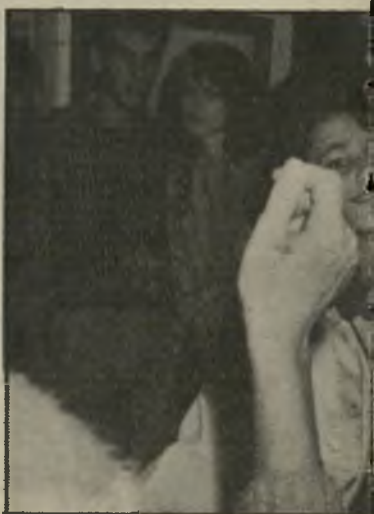
בלי בת ה-16 (למעלה) רקדה במסיבת יום-ההולדת השמונה-עשרה בתצלום מימין) שהיתה למוזמנים בלבד.