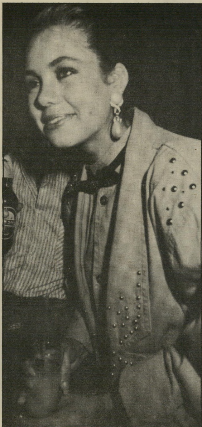
לשעבר מלכת-היופי והיום דוגמנית מבוקשת, מבלה בדיסקוטק, בשעה 3 לפנות בוקר. היא עמדה סמוך לבר ולגמה כוס מיץ תפוזים נטול אלכוהול.