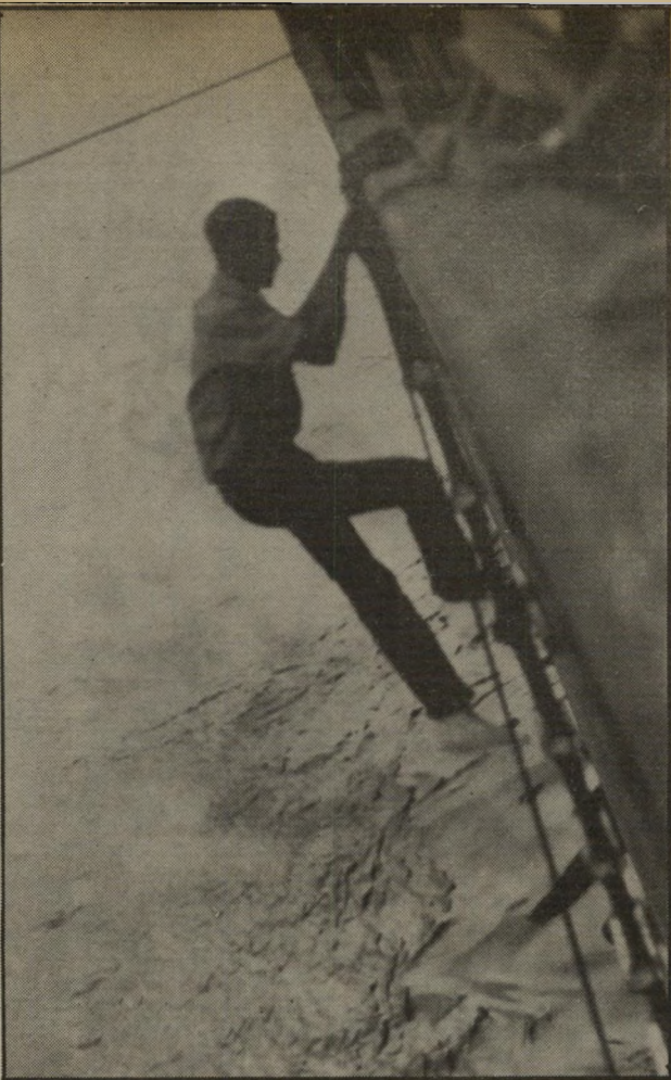
נוסע סמוי אזרח טנזניה שנתגלה על האוניה מורן יורד מעל הספינה. התמונה מזכירה את תמונתו של הנוסע הסמוי שהורד מעל אותה ספינה אל רפסודה רעועה ונשלח אל לביים.

מעולם לא קרה שאל תוך אוניה ישראלית יתגנבו בנתיחת תישעה אנשים (כולל השניים שהורדו), מבלי להישף בחיפושים. אל מול אנשי־הצוות עמדו שיבעה צעירים שחורים, כנגדים קרועים ובלויים. וקבעו עובדה: „אנחנו פה”. העיניים גדולות ושחורות, מציצות בפחד. אין להם דבר לאחוז בו, זולת רחמייהם של המלחים הורים האלה שלא נראים שמחים לגלות אותם. כמו השניים הקודמים, גם האנשים האלה ברחו מטנזניה. ארץ עניה הנה תונה במישטרו השמאלני של יוליוס נירירה. הם ברחו מהעוני, בתיקוה למצוא עבודה בארץ אחרת. קניה למשל. אבל ההימור שלהם היה מוטעה. יעדה הבא של האוניה הישראלית היה דרום־אפריקה. לשם אין נותנים לשכמתם להיכנס. גופם קטן ומצומק וכל חייהם השחורים שווים כקליפת השום ותלויים בהימור הזה הבלתי־מוצלח. ברגע הראשון אחרי הופעתם הם