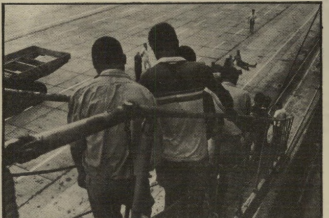
סמויים מורדים כמה נוסעים סמויים מורדים כנמל דאר־אל־סלאם בטנזניה. אחרי שהתגלו כשהם נחבאים על הסימונים, שבה האוניה על עיקבותיה כדי להוריד אותם.

הימור מוטעה שוב שייטה לה מורן. בתחילת דצמבר, על מימיו השקטים של האוקיינוס ההודי, עבר לילה וכא הבוקר, ואיתו שוב הפתעה. והפעם הופיעו מתוך כסן האוניה — שיבעה. הצוות נדהם, ואפילו התחיל לחשוש. שיבעה אנשים הם ככל זאת כוח.