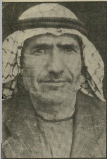
יורגן אל-אקרע דס על האדמה

מיס נדמה שלגורמים הישראליים המי טפלים בצדדים החוקיים של העסקות אין כל רצון לפתור את הבעיות ולגלות את היופנים והמימנות. וכך נאלץ בעל קרקע, שלא מכר אותה כלל, להתרוצץ הלך ושוב בין המישרדים השונים. בנסיון נואש להציל את חלקת האדמה המשמשת לפרנסת מישפחתו, וכאותה עת כבר חורשים הטרקטורים של הקב"ל לניסיהמתנחלים את השטח שלו ומכ" שירים אותו לבניית וילות והתנחלויות שונות.