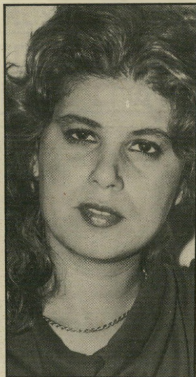
הלן שרעבי - מי ישלם -

הדלת לאיש. ולא כודק מה מגיע אליו לתיכת הדואר. הרבה יחיד שמעורר דאגות וזמאשנותו הן מנהלת עכשיו רומאן עם הזמר זוהר ארגוב, ואולי עם האהבה יבואו גם התשלומים. לבועז לא איכפת איזה זמר ישלם את החובות של אשתו-לשעבר, העיקר שלזמר הזה לא יקראו בועז שרעבי.