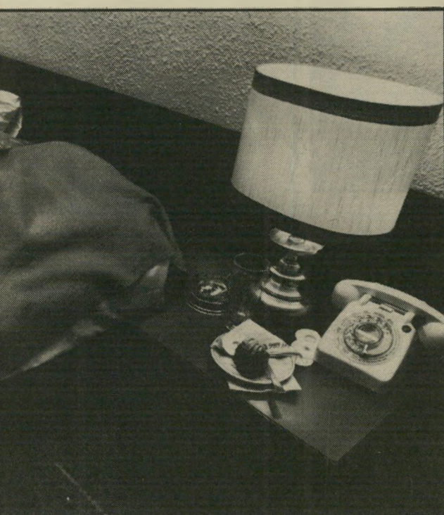
העוגה הבלתי-אכולה ליד ראש הגופה המכוסה ללמוד. לעבוד. לצאת מהבית להכיר אנשים

שהוזמן לבדוק אם הגופה אינה ממולכדת. גם חוקרי זרועות-הבי-טחון היו באתר-הרצח. כשהתברר שהרקע רומנטי - עזבו. בלובי המפואר חגגו שני חתנים ושתי כלות את יום-כלולותיהם. למה לקלקל להם את השימחה!