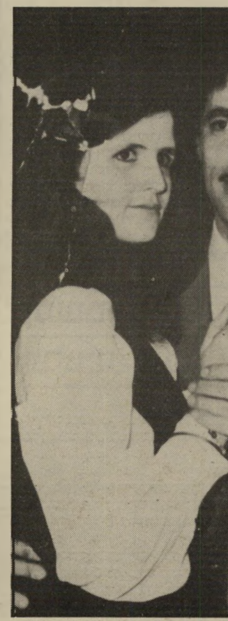
סוויסה בתנונתו בגלל חוסר-זמן, אין לי ידידים

האישית או הטרגדיה המישפחית, כפי שהוא מכנה אותה: פירשת כנו, שנתפס כשברשותו כמות מיסחרית של 800. ס. שהוברח — לרבריו — אל מיוזר דתו בתורכיה. מישטר-תצרפת חיכתה לו. אני שמח שנעצר, ולוא רק בגלל הפחד שהיה נרצח על-ידי הכנפיה