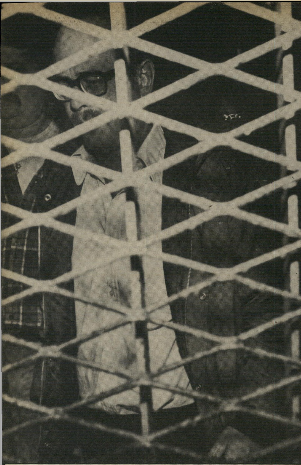
חשוד חלצל בבית-המישפט קריירה מבריקה ואישיות סתומה