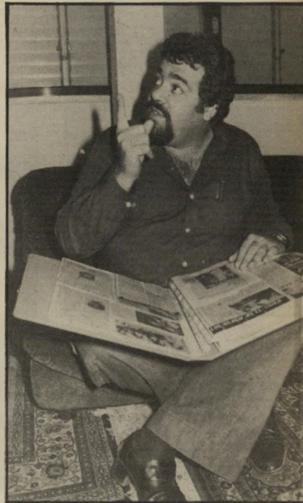
עורך גינת לא בטלוויזיה

כל הכתבה נולדה כשקרבתימישפחה של גינת קראה בעיתון פולני על חייו ועוניו של