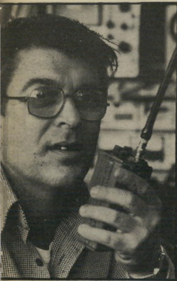
בלבלן שדה — זולים הרבה יותר