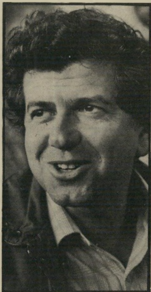
אלקטרונאי ארליך שירותים טובים לא פחות —

עלפי המיכרו, קיבלה החברה החדשה לטלפון סלולארי איזור חיוג חדש, 050, ובו יהיו מגויים מי שירכשו