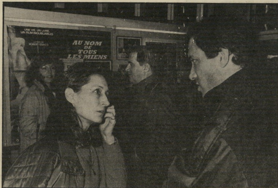
אסי דיין כוכב הסרט הישראלי החדש עד סוף הלילה פגש בכמורה. שנערכה ביום השישי בצהריים. בתיאבוב, את אחותו יעל ואת בעלה דב שיאון (מאחור). דיין, שחקן-קולנוע ובימאי, שיבח את אחותו הסופרת על הופעתה בטלוויזיה ערב לפני כן. בתוכנית סוף ציטוט.

● רועי, הכתב הפלילי החי רוצ של דבר. הגיע לשם מש-בועוד-הליכוד יומן השבוע שש-בק חיים. הוא עצמו לא הודדה פוליטית עם מקום עבודתו הקודם, או עם עורכו, רזני