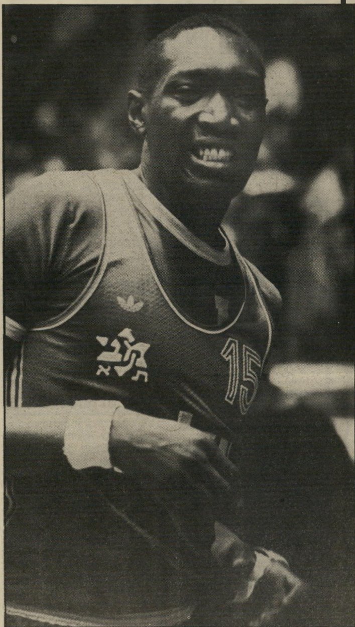
פנים מעוותות מכאב לפני תחילת המישחקה לי ג'ונסון חש בכאבים בידו השמאלית. כשעלה השחקן על הפרקט, קידמו אותו אלפי הצופים בתשואות.