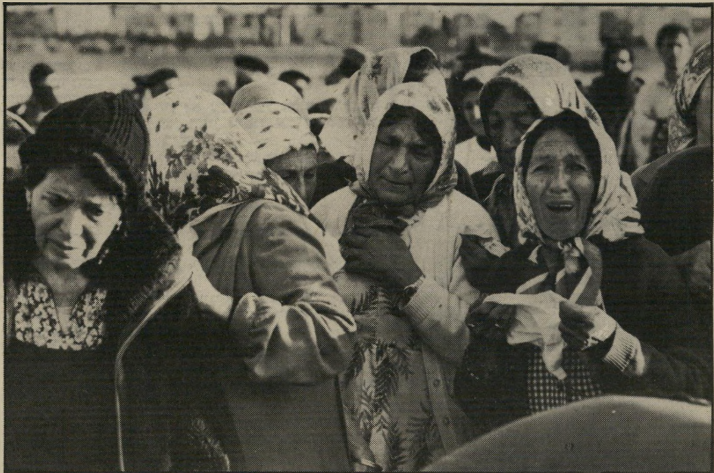
הקורבנות הבאים? עלולות לה יות כל אחת מבין המתאבלות (בתצלום: בעת מסע ההלוויה).