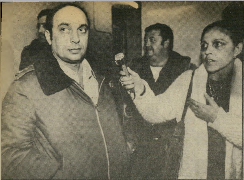
כתבת מנשה עם מפקד-כלא מולק בתחנת חולון למחר לאולפן

הוועדה-מנהל של רשות-השידור אישר תוספת של שני מיליון דולר לתקציב רשות-