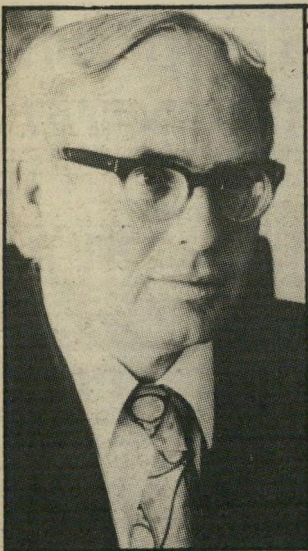
שופט שטרומן יום זה לא שעה

שופט-מעצרים האריך את מעצרו של נגר ב-10 ימים. כאשר הסתיימו ימים אלה, חזרה המיטרה לבית-המשפט. בבקשה להאריך את המעצר שוב. לשם כך השתמשה המיטרה באותה הסכמה של היועץ המישפטי, שהציגה כבר בבקשה הקודמת. עורך-הדין מאיר זיו, סניגורו של נגר, העלה טענה מישפטית מעניינת. הוא טען כי אין אפשרות להשתמש שנית באותו כתב-הסכמה של היועץ המישפטי, וכי יש לפנות אליו בכל פעם שמבקשים הארכת-מעצר, אחרי התקופה הראשונה של 30 יום, כדי שישבו ויבדוק את הצורך בכך. שופט-השלום ראובן זיו השתכנע. הוא פסק הלכה כפי שביקש הסניגור, האריך את המעצר ל-24 שעות בלבד, כדי שהמיטרה תוכל להביא כתב-הסכמה חדש מהיועץ המישפטי. שעה או שעתיים. על כך עירער הסניגור לבית-המשפט ה-