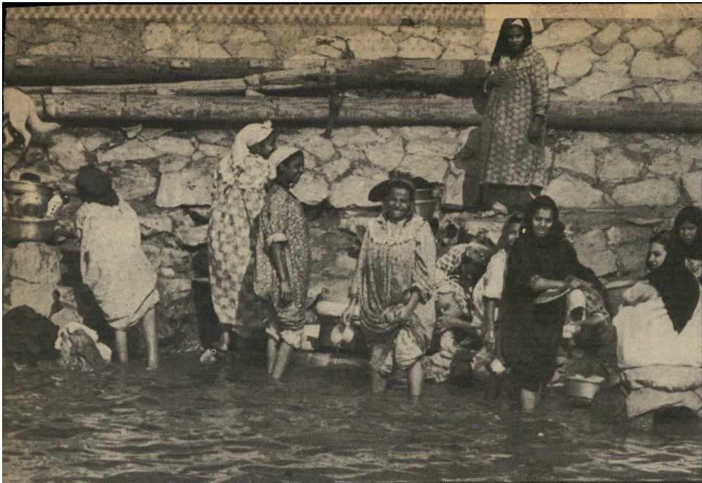
מצריות כפריות מבכרות בשפת הנילוס אני מחוגי העניים. בשבילי זו חרפה שאשתי תעבוד!