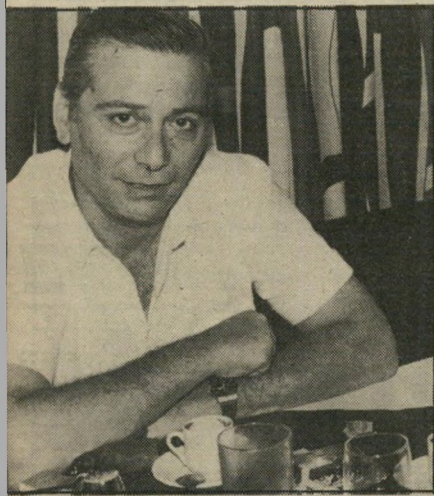
מועמד סער מסיבה

הממשלה בתוך חודש ימים התקבלה ביום השני בישיבה שהתקיימה בלישכתו של ראש-הממ שלה בכנסת.