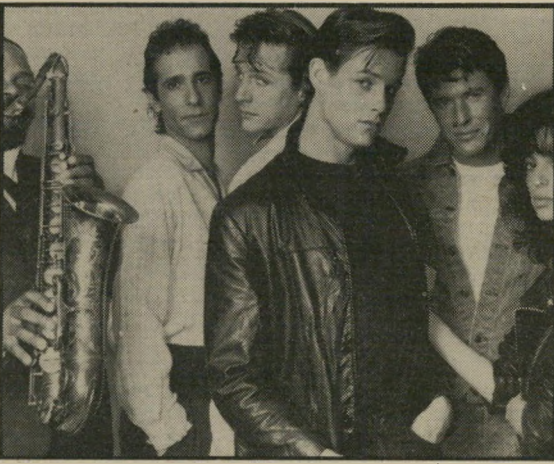
מייקל פארה: מבוגרים מדי, צעירים מדי

הצרה עם הסרט היא שאותו חלק עלילתי המתרחש היים הוא פושר וחסר-דימיון, אלה הם למעשה רק שברירם של עלילה, אשר צריכים לקשור בין פרק אחד של זיכרונות לפרק שני, ואילו הזיכרונות עצמם - שצריכים לדבר על מערכת-היחסים שהיתה בתוך אותה להקה, על העימות שבין אותם שרצו בסך-הכל להרקיד את הנערים שבאו לשמוע אותם לבין אדי עצמו, שחלם על שבירת מוסכמות ופריצת גדרות לקראת