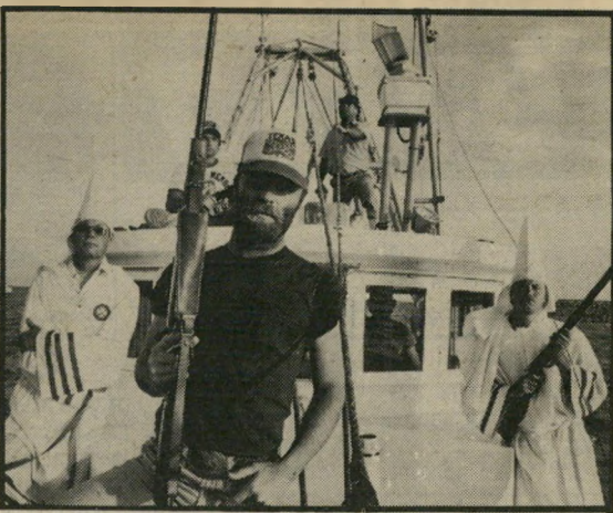
אד הריס: המוסר עובר דרך הכיס

הפעם מדובר בפליטים וייט-נאמיים, שהגיעו לארצות-הברית אחרי נסיגת אמריקה מהודו-סין. הם יושבים בתנאים תת-אנושיים בעיירת-חוף בטקסאס, ומתפרנסים שם מדיג. ליתר דיוק, הם מספקים כוח-עבודה זול לסיטונאים בעלי סירות, המשוקים דגה, בעיקר חסילונים, לכל הסביבה הקרובה. התחרות מצד התושבים החדשים פוגעת קשה בדייגים העצמאיים בני-המקום, שאינם מסוגלים לשלם את חובותיהם, להחזיק את הציוד שבידיהם ולהתחרות בסיטונאים. התוצאה היא, כמובן, מאבק נגד מה שיראה כתחרות בלתי-הוגנת, ומאחר שלתחרות זו יש סימניה-יכר חיזוניים בולטים - כי המתחרים הרי כולם וייט-נאמיים - לובשת הדחייה אדרת גיזענית, שעד מהרה מזמינה הצטרפות של כל בירון ופאסיסט, שרק מחכה להזדמנות כדי ללבות יצרים. האירוניה במצב היא, שרוב הדייגים במקום היו בעבר הלא-רחוק חיילים בצבא אמריקאי שנלחם בוייט-נאם, למען