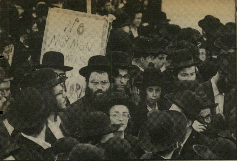
הפגנת-חרדים בכיכר-השבת בירושלים פרוש לחץ את ידי. הוא התייחס אלינו בחום רב!

שם. אני מדבר על כל נוצרי, לאדרווקא על המורמונים. בכל ימות השבוע אפשר לראות ליד קיבוץ דגניה, במקום שהירדן יוצא מהכנרת, מקום מיוחד שהוכן עליידי ממשלת ישראל כדי לערוך בו את הטבילה. כך שבמשך 17 השנה שאנחנו פה היו כמה הטבלות, והיו אפילו כמה הטבלות של יהודים, אבל לא כתוצאה של פעילות מיסיונרית של הכנסיה שלנו, ובווראי לא של האוניברסיטה שלנו.