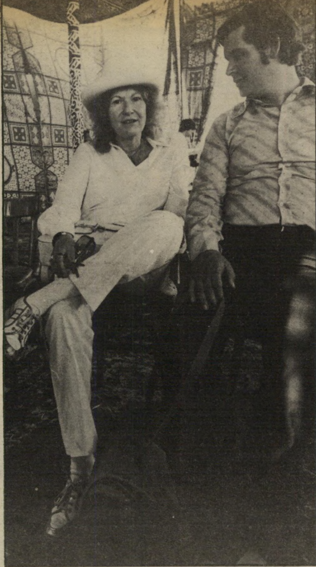
עתונאית גולן במצריים* גינאית בלבן ניצחי

הבני. בי. סי. הכריטי לענייני חוף-השנהב. רירתה היפה בפאריס, שבה מוקד צבת פינה לזיכרו של אביהו, הפכה בית-זעוד למדינאים שונים, וגם ליש ראלים רבים. עליוה, אשתו של השרון מיכה שגרייר, התארחה אצלה. בדרך מרירתה עברה ליד בית-הכנסת הסמוך, ונהרגה בהתקפת אנשי אברנידאל.