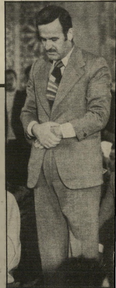
הנשיא אל־אסד צחלה לרגע, מחיר לשנים

כל ממזר דירקטור. כאשר הגיע הליכוד לשלטון, היו אנשיו רעבים מאוד. בימי היישוב, וב־29 שנות ה־מדינה, הושארו מחוץ למעגל הפנימי של חלוקת־השלל. הם רצו להשיג מהר את כל אשר הפסידו.