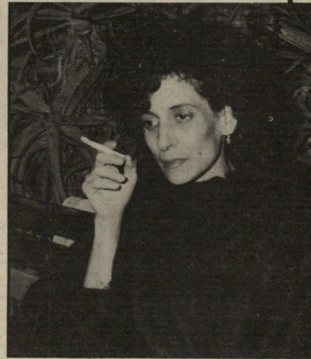
ריבקה זוהר קיבלה כל מה שרצתה

ביניהם אהבה גדולה. מאז הם ביחד. בעלי שמיעה טובה מאוד שמו לב להבדל בקולה של ריבקה, כשאמרה את המישיפט „אני נוסעת לארצות-הברית לטידורים, ותיכף חוזרת ארצה.“ בקתלה היא אמרה את זה בשקט, עכשיו היא כמעט צועקת את זה. עכשיו ברור לי לגמרי על מה חשבה ריבקה זוהר, כששרה את שירה הידוע „מה אבקש“. היא בוודאי ביקשה לעצמה שבארץ יקבלו אותה יפה, שתהיה לה הצלחה על הבימה ושתמצא גבר אוהב. את כל זה היא קיבלה. מה נשאר לה לבקש?