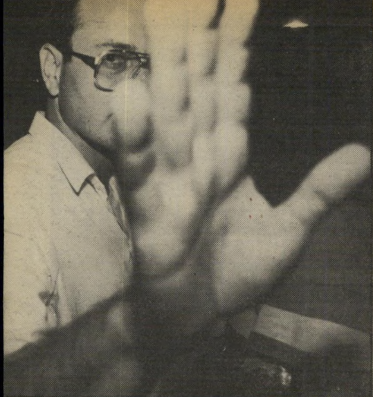
סגן-שר מילוא מצח נחושה