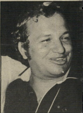
חשוד ג'ינג'י כתב-אישום

בכל מיקרה. עצם הופעתו במקום זה בשעה זו. באה להגיד לחשוד: המיפלגה והשילטון מאחורך — וזאת בשעה שחוקרי-המישטרה בודאי ביקשו לשכנע את החשוד למסור עדות נגד גורמים פוליטיים-מיפלגתיים. שאליהם העביר (כפי שטען) כספים.