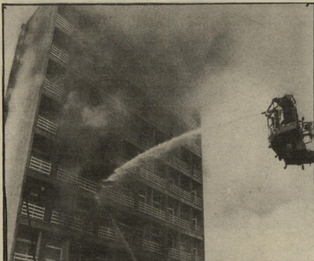
רב מציץ לוודא שריפת עציץ

● בברוקלין שרפו חרדים תחנות בהקפות בעת מישחק בייסבול • תפילות לעצירת גשמים נענו והתחנות נשארו יבשות