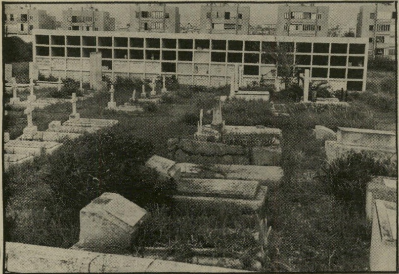
קברייקומות ביפו (בחלק העליון של התצלום) לא צריך להרחיק את העדות

אין כל צורך להתרגש מהפיספוסים הנוראיים של הטלוויזיה בירושלים, כאשר מתרגמים שוגים בתרגום מאנגלית לעברית. רק השבוע שמעתי מפי חבר, עיתונאי הדובר רוסית, שהיה בשליחות בז'נובה, בעת מיפגש הגרולים, כי מה שקורה בירושלים קרה גם בז'נובה. במסיבת העיתונאים עם גורבצ'וב נדהמו אנשי ההתקשורת לשמוע את המתורגמת (מרוסית